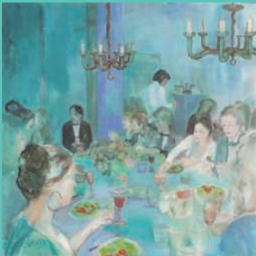
"Le Diner", acryl op linnen, 100 x 100 cm