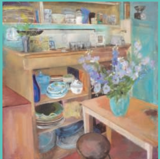
"Country Kitchen II", acryl op linnen, 100 x 100 cm