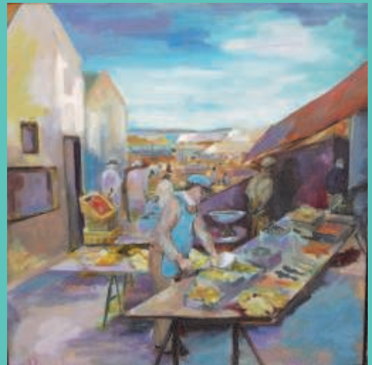
"Mediterranean Market", acryl op linnen, 100 x 100 cm