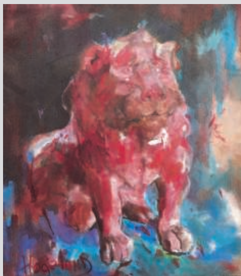
"Je Maintiendrai", acryl op linnen, 100 x 120 cm