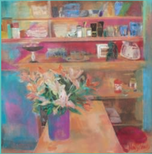
"Country Kitchen", acryl op linnen, 100 x 100 cm